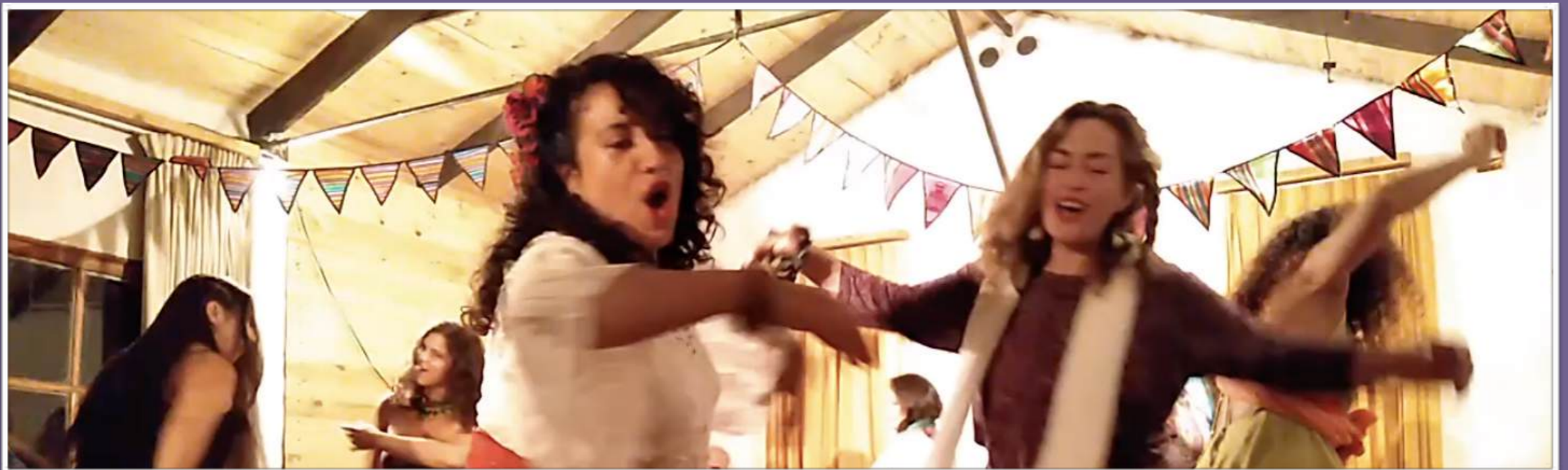
Presentación Taller Canto Libre 2020, Maule

Este taller ofrece por la noche un espacio para la exploración creativa de la voz y la corporalidad. Los participantes aprenderán técnicas de improvisación, experimentando tanto con diferentes sonidos, ritmos y melodías como la expresividad géstico-corporal en colectivo. Se trabajará el canto acompañado de un instrumento de percusión y se fortalecerá aspectos de audio-perceptiva y de coordinación de manera lúdica.