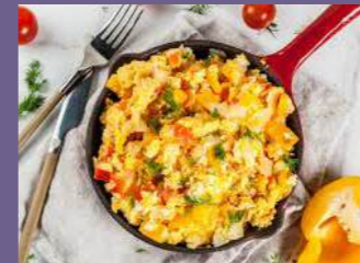
Huevos u omellette con verduras

Pan amasado, huevos en variadas recetas, mantequilla, té, café y agua de hierbas.