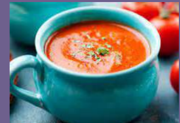
Sopa de Tomate y/o zapallo o Tortillas de verduras