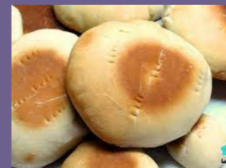
Pan amasado tradicional, harina de trigo, sal, grasa vegetal, levadura

Frutas de la estación, cereales orgánicos, yogurt casero, pan amasado, mantequilla y mermelada, té, café, agua de hierbas