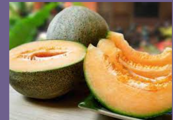
Melón calameño y/o tuna, sandía y/o duraznos