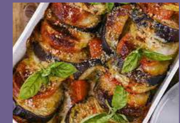
Lasagna de Berenjenas